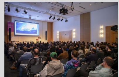
tmt Vortrag Download