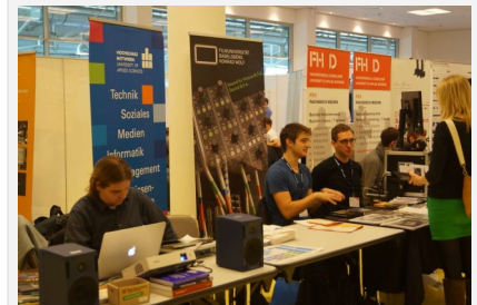
Download Education Forum

Bildungseinrichtungen auf der diesjährigen Tonmeistertagung tmt31