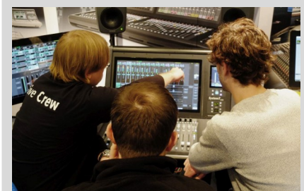
Download TMT Hands On