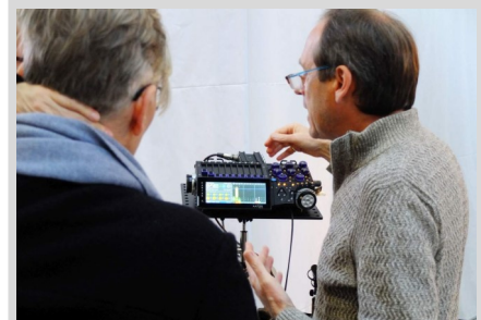
Download TMT Produktvorstellung